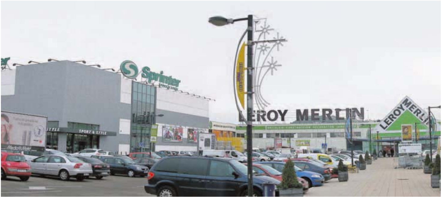
Instalaciones de Leroy Merlin, el hipermercado del bricolaje y la jardinería, en el centro comercial Equinoccio Park de Zaratán.