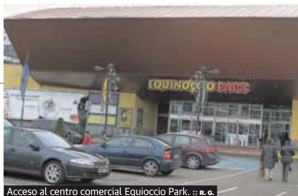
Acceso al centro comercial Equinoccio Park.