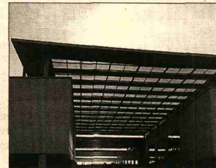
A la izquierda, proyecto de centro comercial en Agadir. A la derecha, perspectivas de Almazar.