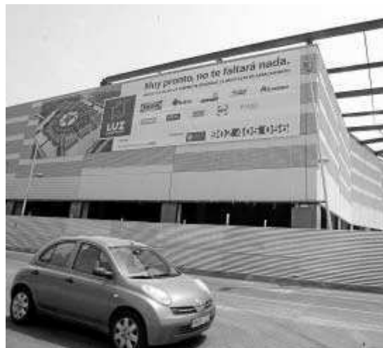
Aspecto de varias naves del parque con carteles alusivos.

metidas, sencillas, sinceras, con ambición, participativas e íntegras. No es necesaria experiencia ni una formación determinada". Es el encabezado de una oferta registrada en un foro de Internet por Bricor. La cadena de hogar de El Corte Inglés "selecciona para su nuevo centro en Jerez de la Frontera a 200 empleados para trabajar como vendedores de decoración, baño, cocina, ordenación, bricolaje...". Seguimos buscando en Google y aparecen nuevas oportunidades laborales: "Experiencia de al menos dos años en la venta de electrodomésticos y en la dinamización de equipos de trabajo". Son dos de los requisitos para acceder al puesto de jefe de sección en la nueva tienda Worten de Jerez publicado en otro portal de Recursos Humanos de Internet.