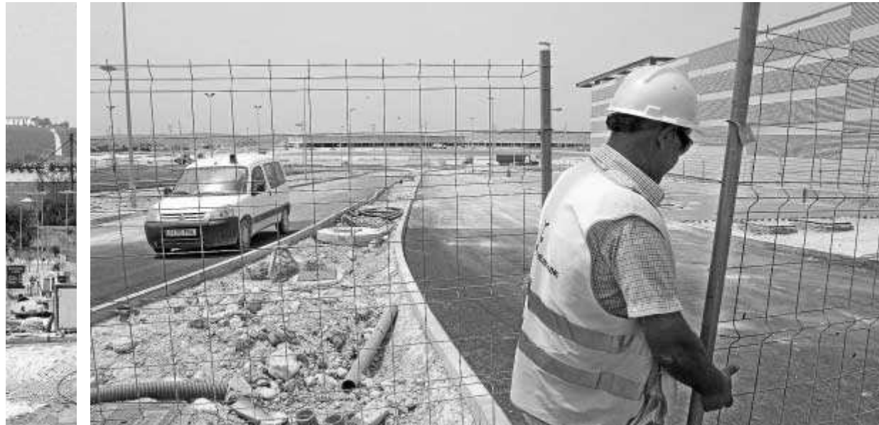
Un operario cruza la valla de una de las entradas de Luz Shopping, en plena fase de urbanización.