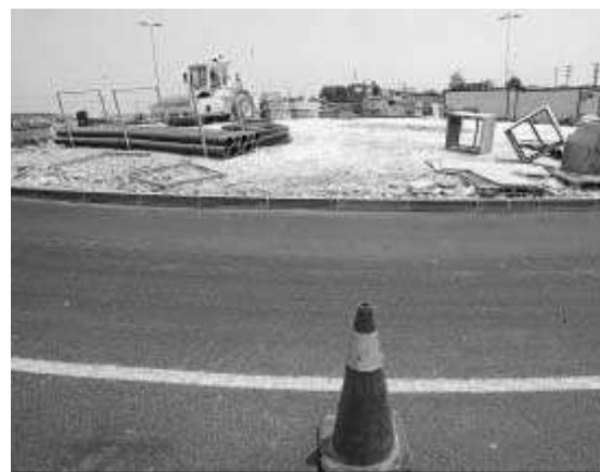
Nueva rotonda. La avenida de Escandinavia, que desde hace meses conecta el centro comercial Área Sur con el entorno de Ikea y Luz Shopping, contará con una nueva rotonda, para la que ya han comenzado los trabajos.